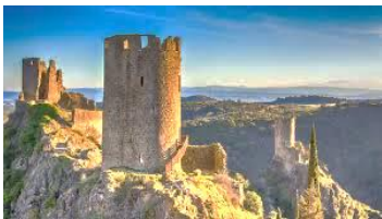
De Katharenburchten in Lastours

De hele streek ademt beladen geschiedenis. Verspreid over het hele gebied vind je burchten en vestingen waar vervolgte Katharen hun toevlucht zochten. Tevergeefs. De Katharen werden uitgemoord, tot de laatste man.