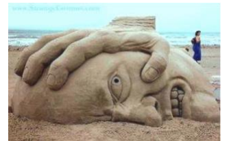
Nood aan verlossing in elke tijd...

Helemaal achter in de zaal stond langzaam iemand op. De mensen draaiden zich om en herkenden hem. Het was de oude bisschop van de stad. Jarenlang had hij gevangen gezeten. Nu leefde hij verge-