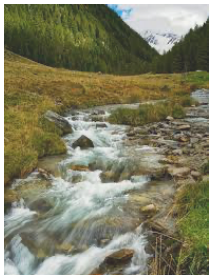
Vriendschap, even nodig als water voor wie dorst heeft!

Is de mens een soort Jan Klaassen? Trekt God aan alle touwjes van zijn leven?